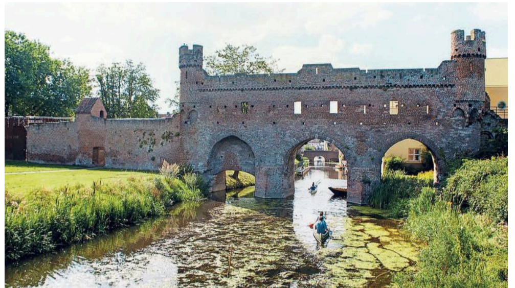
De Berkelruïne in Zutphen is 700 jaar oud.