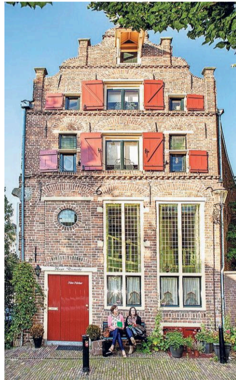
Fraaie panden in Deventer.

Herinneringen aan een tijd dat Amsterdam nog in het moeras lag en het Binnenhof nog moest worden gebouwd. Mogen ze in Oost-Nederland een beetje trots op hun verleden zijn?