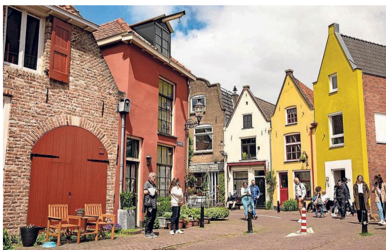
Het Bergkwartier is een gezellige buurt bij het centrum van Deventer.