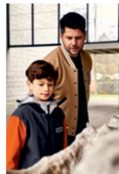
Kunst ganz nah, kindgerecht und in aller Ruhe erleben