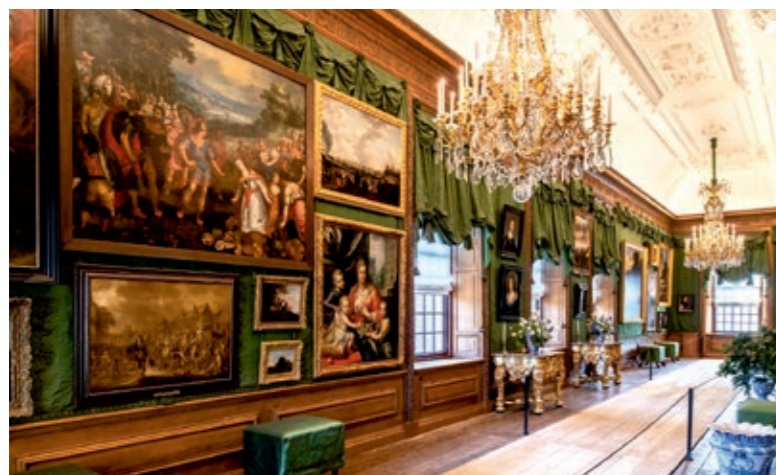
Ob Gemäldesammlung oder Brunnen – Reichtum wurde in Szene gesetzt

Der royale Garten hatte also alles, was sich ein königliches Paar nur wünschen konnte. Und nicht nur das. Denn die eigentliche Attraktion waren Hans und Parkie, zwei indische Elefanten, die ein Geschenk der Niederländischen Ostindien-Kompanie aus dem damaligen Ceylon (Sri Lanka) waren. Begeisterte Besucher strömten scharenweise nach Het Loo, um die dicken grauen Rüsseltiere zu bewundern, die durch den Palastgarten stampften und in einem umgebauten Kuhstall wohnten.