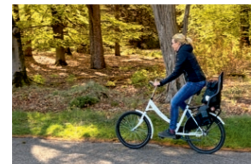
Taschen, Jacken und Co. passen perfekt auf die Kindersitze der „witte fietsen“

Mehrere Mooreseen verbreiten zu jeder Jahreszeit ein mystisches Flair