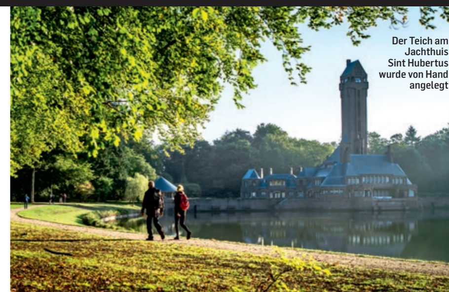
Der Teich am Jachthuis Sint Hubertus wurde von Hand angelegt

Der Nationalpark De Hoge Veluwe liegt in den Niederlanden, in der Provinz Gelderland, zwischen Arnhem, Apeldoorn und Ede. Er ist Teil der Veluwe, einer weitläufigen Landschaft aus Wäldern, Heideflächen, Mooren und offenen Sandflächen. Besonders prägend sind die stillen Kiefern- und Laubwälder, die weiten Heidegebiete und die fast wüstenartigen Sandverwehungen. Die Region gilt als eines der bedeutendsten Naturgebiete der Niederlande und bietet Lebensraum für Rothirsche, Wildschweine, Mufflons und viele Vogelarten. Durch seine abwechslungsreiche Landschaft wirkt der Park überraschend ursprünglich und weitläufig – ein Stück wilde Natur mitten im Herzen des Landes.