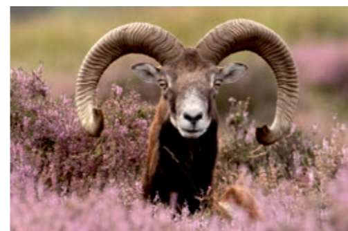
Zweihundert Mufflons streifen als „lebende Rasenmäher“ durch die Heide

Mehrere Mooreseen verbreiten zu jeder Jahreszeit ein mystisches Flair