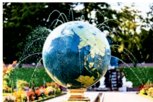
Der Globus-Brunnen demonstriert den Machtanspruch der damals herrschenden Elite