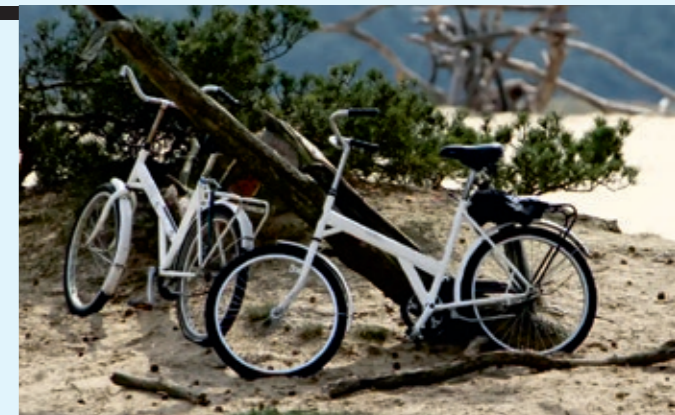
Die weißen Markenzeichen der Hoge Veluwe

Beim nächsten Mal komme ich mit dem Gravelbike und meinen Bikepacking-Taschen. Die Region möchte ich unbedingt länger und auch auf schmalen Pfaden erkunden. Doch es gilt: Hier ist jedes Rad das richtige. Die gesamte Veluwe ist ein Fahrrad-Mekka und eignet sich sowohl für ausgedehnte Gravel- und Mountainbike-Abenteuer, zum ge-