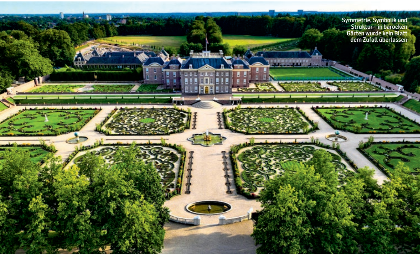
Symmetrie, Symbolik und Struktur – in barocken Gärten wurde kein Blatt dem Zufall überlassen