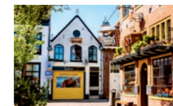
De Ouderwetse Bakkerij in Harderwijk verkauft die Spezialität Zeebeur

Start dieser Tour ist in Apeldoorn vor dem Paleis Het Loo. Wer Zeit hat, um einen Blick zurückzuwerfen, sieht das Kanadische Befreiungsdenkmal, den Mann mit den zwei Hüten. Anschließend geht es ein Stück Hauptstraße entlang, bevor man in das Grün bzw. Beige der Veluwe einbiegt. Auf meist ebenen Forststraßen erreicht man nach gut 16 Kilometern Elspeet. Zeit für ein „hapje“ – Pommes, Pfannkuchen oder ein belegtes „broodje“ passen immer. Danach sind die Düne Beehuizerzand bzw. einfach nur die Heidelandschaft lohnende Fotostopps, bevor man schließlich in die historische Altstadt von Harderwijk einrollt.